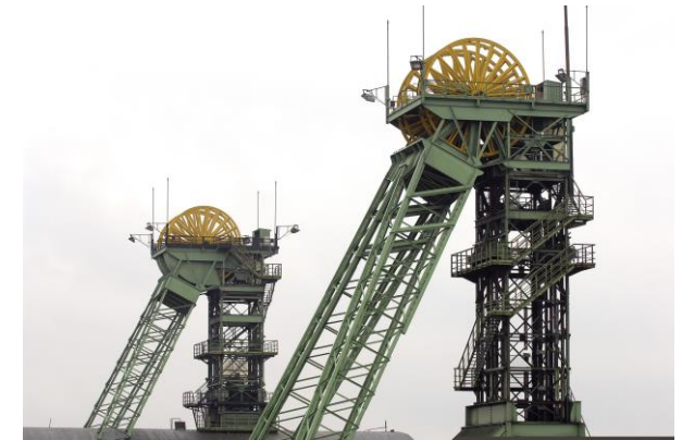
Initiativkreis für Denkmalpflege, Stadterhaltung und Stadtbildpflege in Ahlen e. V.